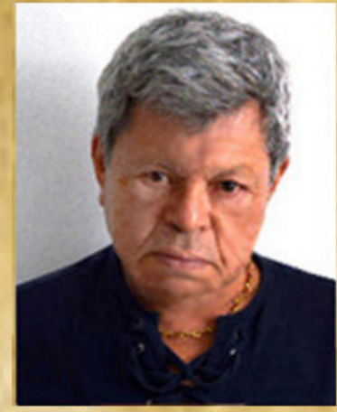
Secrétaire - Assistant Trésorier